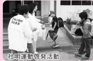
社明運動啓発活動