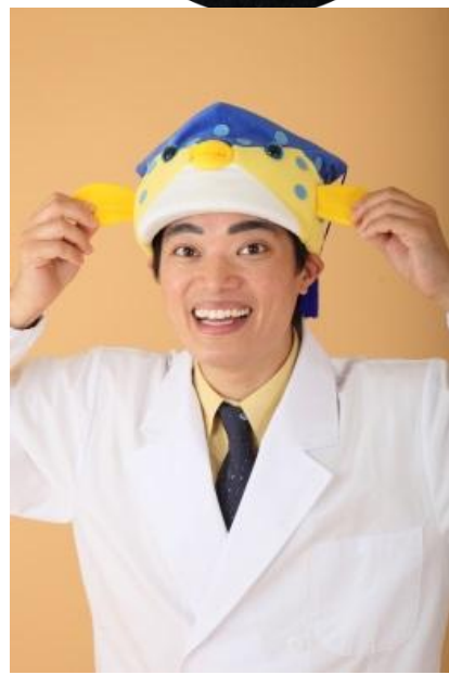
さかなクン 国立大学法人東京海洋大学 名誉博士・客員准教授