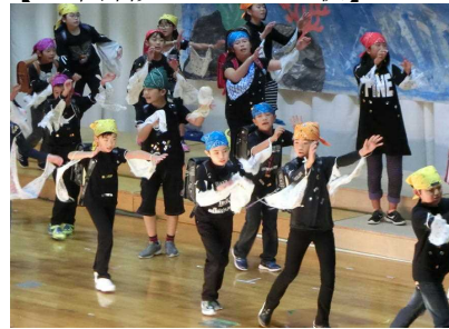
【5年演劇 海のふしぎ】