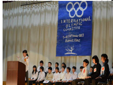
【6年劇 東京オリンピックに向けた夢】