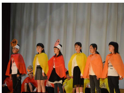
【2年群読 たのしい秋】