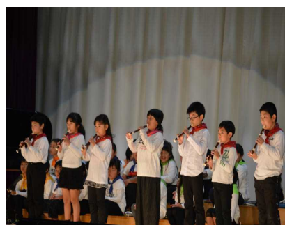
【3年合唱・合奏 レッツゴーいいことあるさ】