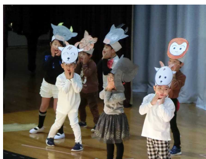
【1年劇 がっこうたんけん】

今年も広い体育館がいっぱいになるほどのお客さんにご来場いただき、演技の始まりと終わりに幕が閉まるまで、温かい拍手をいただきいたことによって、子どもたちは喜び、自信をつけることができました。児童に身に付いた「伝える力」と「協力する力」が、さらに高まるよう指導していきます。