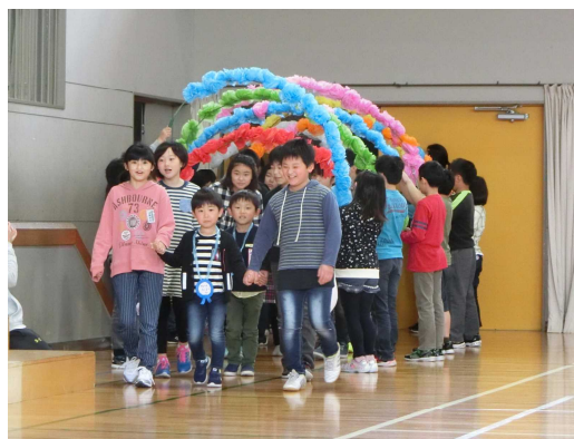
【花のアーチをくぐって入場】

最後に1年生がお礼の意味をこめて、「どきどきどん1年生」の歌を元気に合唱しました。最高学年としての6年生の活躍はもちろんのこと、それぞれに進級した2～5年生の子どもたちの意欲や頑張りが見事に表現され、とても充実した会になりました。