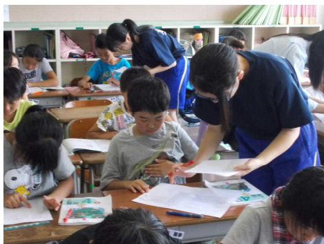
【熱心に教える志中生】

最近特に、校種間の連携が大切だと言われていますが、小学生にとって中高生に教えてもらうのは、教員に教えてもらうこと以上に有意義な時間だったと思います。そのお礼に小学生は中高生にお礼のメッセージを書きました。このような交流を今後も続けていきたいと思っています。