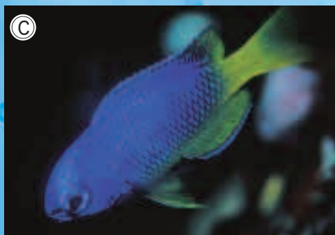
写真C ソラスズメダイ幼魚 (インド洋～太平洋に分布。国内では千葉県以南の各地に分布。)