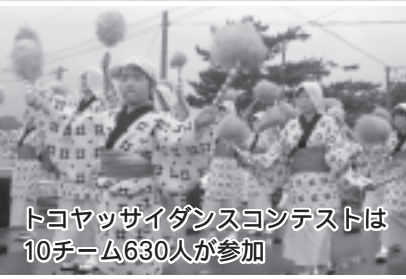
トコヤッサイダンスコンテストは10チーム630人が参加