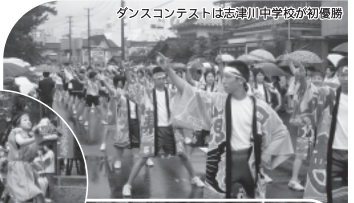
ダンスコンテストは志津川中学校が初優勝