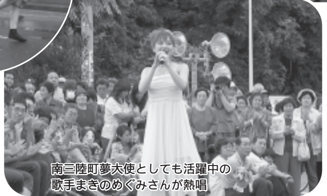
南三陸町夢大使としても活躍中の歌手まきのめぐみさんが熱唱