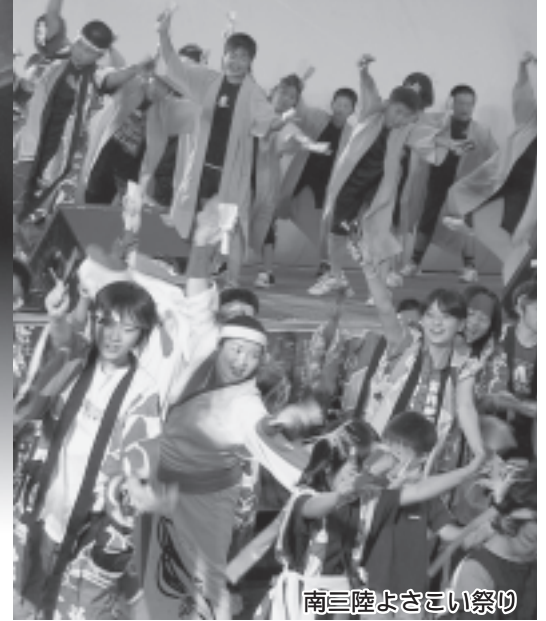
南三陸よさこい祭り

志津川湾夏まつりは、小雨が降る中のスタートでしたが、行政区の山車パレード、創作ダンス「トコヤッサイ・ダンスコンテスト」などの熱い演技に雨は上がり、夕方のお祭り広場のプログラムは、多くの観客でにぎわいました。