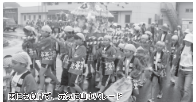
雨にも負けず、元気に山車パレード