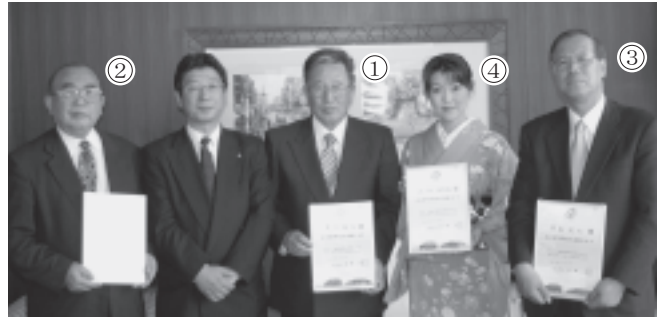
仙台圏の夢大使の皆さん