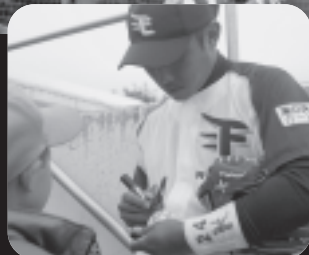
ファンにはサービス！楽天の選手は、気軽にサインに応じてくれました