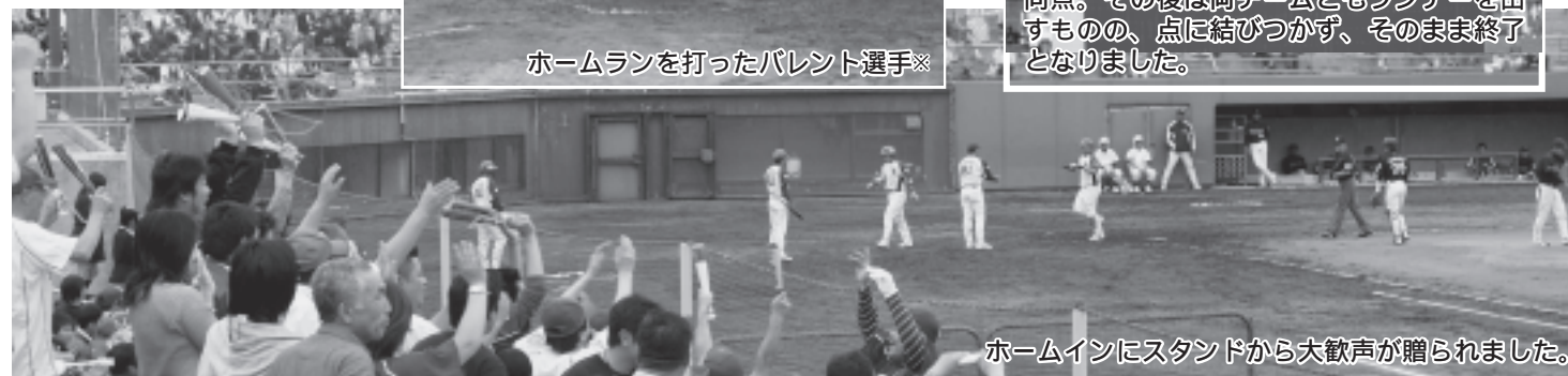
ホームインにスタンドから大歓声が贈られました。

球団ホームページで、試合結果が見られます http://www.rakuteneagles.jp/game/06farm/06/18.php