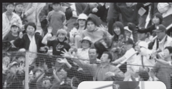
ファウルボールや、選手が投げ入れるボールに、客席はにぎやか