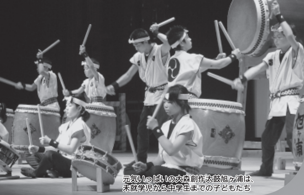
元気いっぱいの大森創作太鼓旭ヶ浦は、未就学児から中学生までの子どもたち