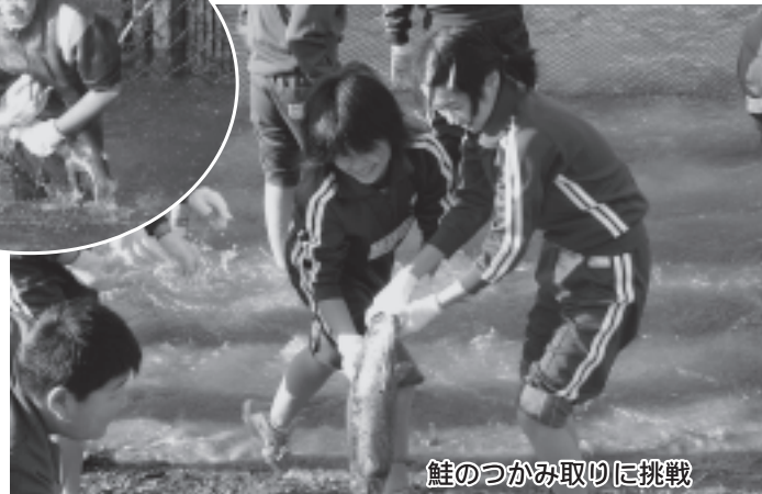
鮭のつかみ取りに挑戦

冷たい風が強く日でしたが、子どもたちは寒さにも負けず、飛び跳ねる鮭と真剣勝負。全身びしょめれになりながら鮭つかみを体験しました。