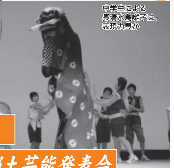
中学生による長清水鳥囃子は、表現力豊か