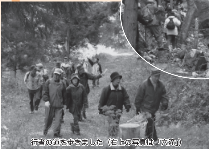
行者の道を歩きました (右上の写真は「穴滝」)