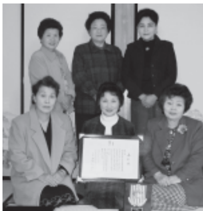
南三陸町志津川地区 交通安全母の会

12月8日（木）、東京都の「歌舞伎座」で行なわれた、全国交通安全母親大会表彰式典において、「南三陸町志津川地区交通安全母の会」が表彰されました。