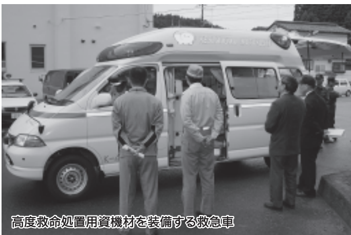
高度救命処置用資機材を装備する救急車