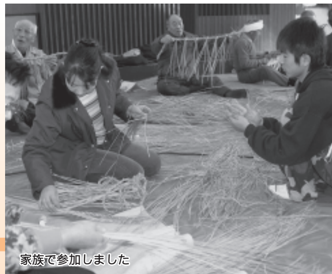
家族で参加しました

初めて参加した受講者は、「わら縄をなうのは初めて。自分にできるのか不安でしたが、やってみると思ったより上手くできました。参加して良かったです。」と感想を話していました。