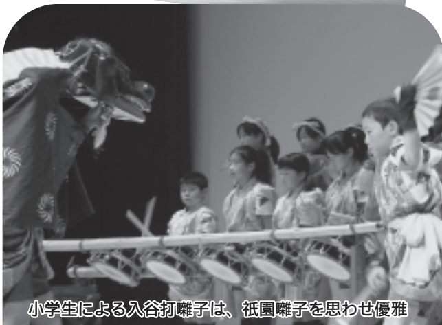
小学生による入谷打囃子は、祇園囃子を思わせ優雅