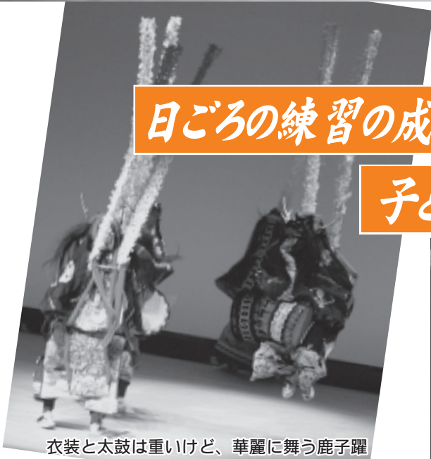
衣装と太鼓は重いけど、華麗に舞う鹿子躍