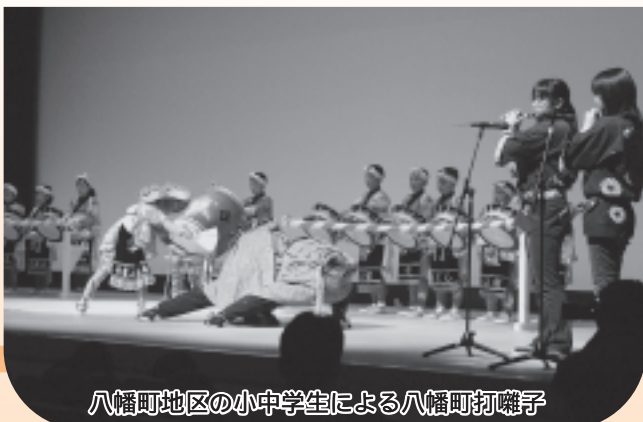
八幡町地区の小中学生による八幡町打囃子

12月11日(日)、町総合体育館「バイサイドアリーナ」文化交流ホールを会場に、「子どもたちの郷土芸能発表会」が開催されました。