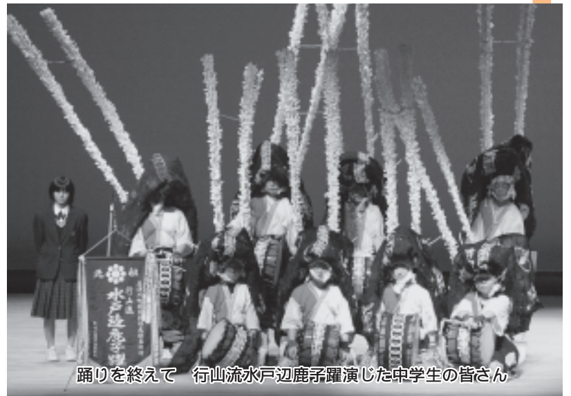
踊りを終えて 行山流水戸辺鹿子躍演じた中学生の皆さん