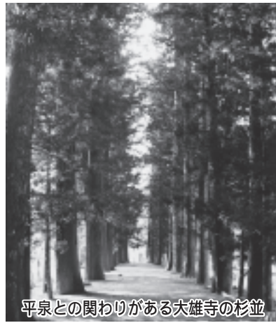
平泉との関わりがある大雄寺の杉並木