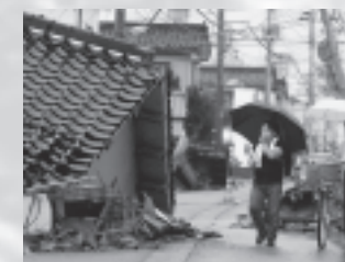
建物の倒壊（柏崎市東本町）