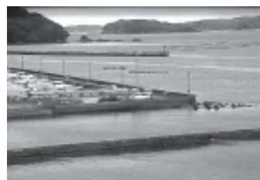
▲町営松原住宅屋上（防災カメラからの映像）