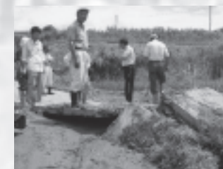
道路の崩壊（飯綱町）