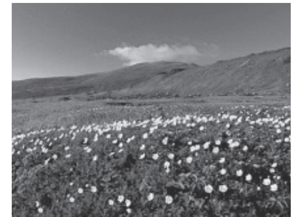
ヒナザクラの群生が広がる夏の月山(山頂付近)

車で八合目まで行くことができます。体力に自信のある方は、残雪を踏みしめ山頂を目指し、登山にチャレンジしてみたいはいかがでしょうか。