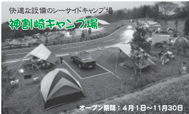
快適な設備のシーサイドキャンプ場 神割崎キャンプ場