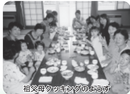
祖父母クッキングのようす

申込み・問い合わせ 子育て支援センター(志津川保育所内) ☎46-3692、46-3679 伊里前保育所 ☎36-2062