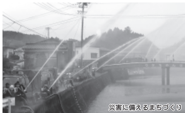
災害に備えるまちづくり