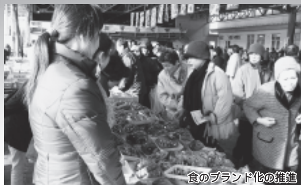
食のブランド化の推進