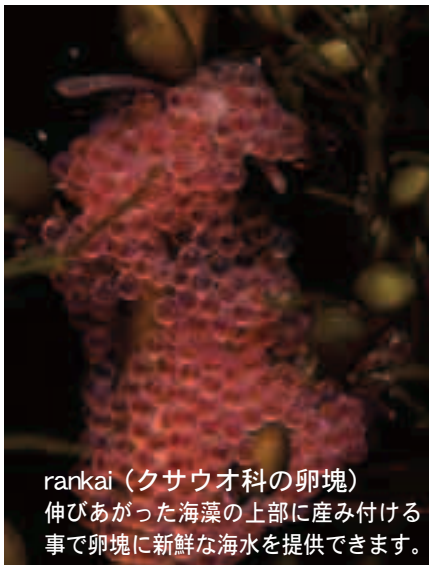
rankai (クサウオ科の卵塊) 伸びあがった海藻の上部に産み付ける 事で卵塊に新鮮な海水を提供できます。