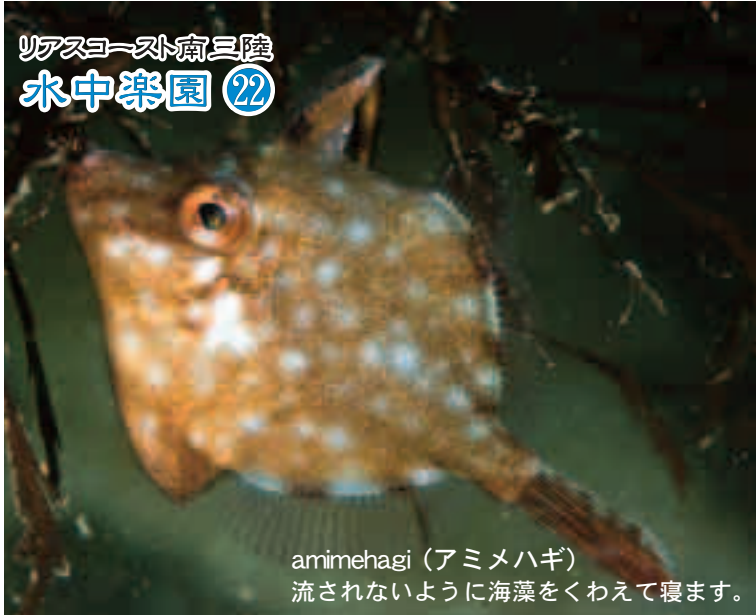
amimehagi (アミメハギ) 流されないように海藻をくわえて寝ます。