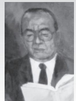
<東北生活文化大学生生活美術学科の教員による油絵>

先頃、波伝谷文化センターで『波伝谷の民俗』調査報告会が開かれた。この調査は文化庁の芸術拠点形成事業として、東北歴史博物館と東北学院大学民俗学研究室の共同調査によるもので、生業(漁業や農林業など)や社会組織(契約講や観音講など)・人の一生・年中行事・信仰など、地域の特色を探り、その貴重な有形無形の民俗文化財を継承しようという目的があった。