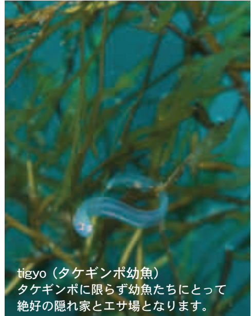
tigyo (タケギンポ幼魚) タケギンポに限らず幼魚たちにとって 絶好の隠れ家とエサ場となります。