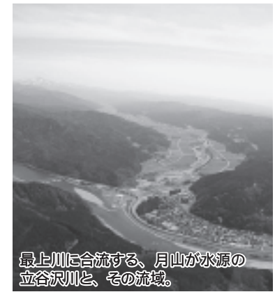
最上川に合流する、月山が水源の立谷沢川と、その流域。

立谷沢川流域は、東北屈指の清流・立谷沢川と出羽の山々が織りなす、清らかで美しい、延長20キロメートルにわたる山あいの地域です。