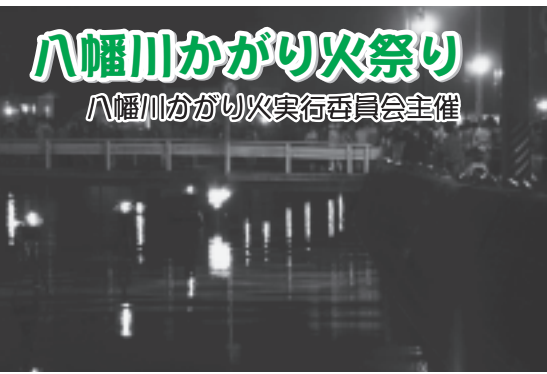
八幡川かがり火祭り 八幡川かがり火実行委員会主催

8月25日(土)の夜、八幡川の八幡橋から汐見橋の流域にかがり火を焚き、また沿道に竹灯笼を置いて、幻想的な雰囲気を作り出し、多くの人たちに、夏の夜の新しいイベントとして心に焼き付けていただきました。