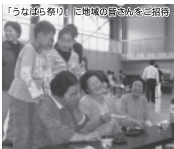
「うなばら祭り」に地域の皆さんをご招待