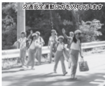
交通安全運動に力を入れています