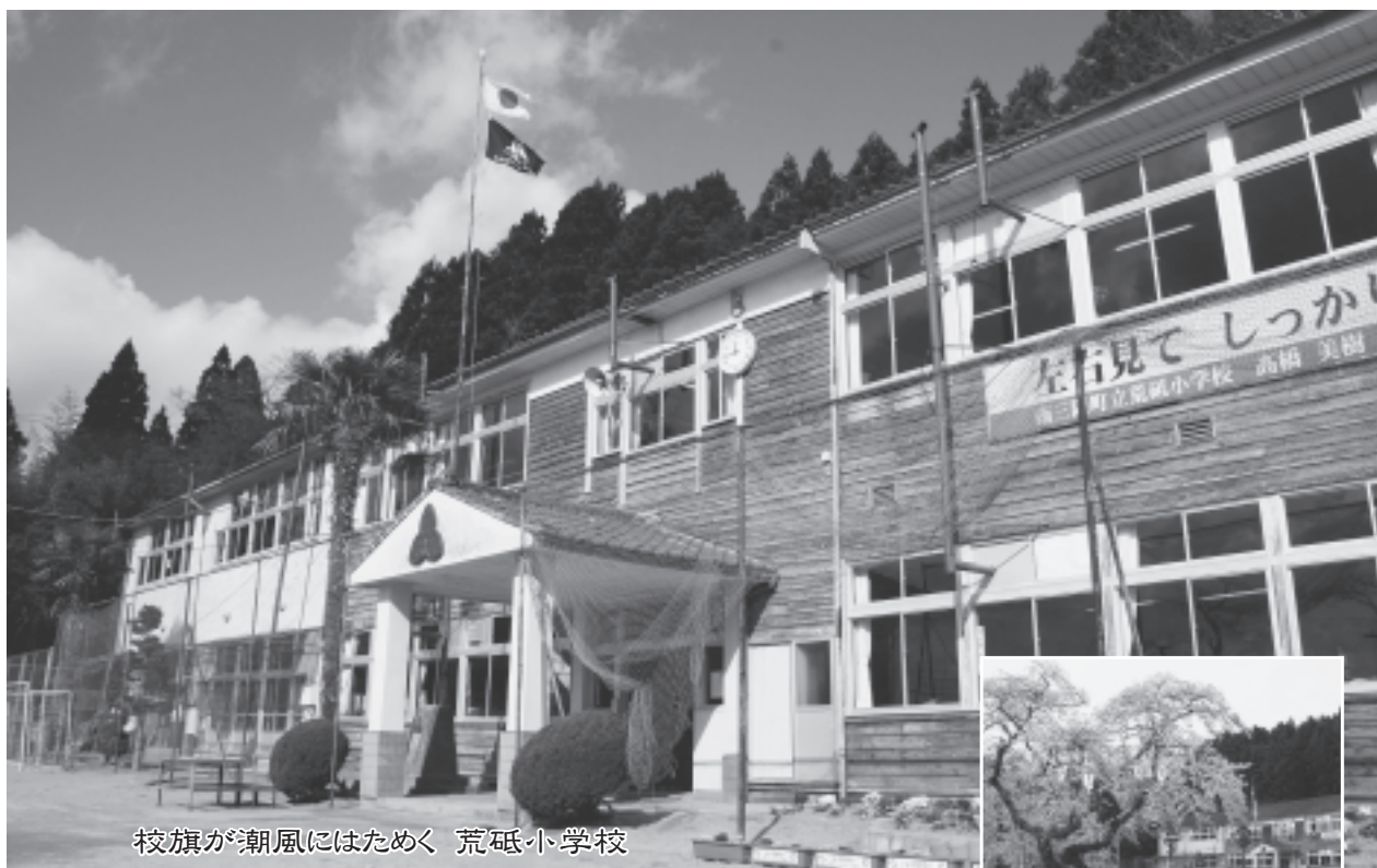
校旗が朝風にはためく 荒砥小学校