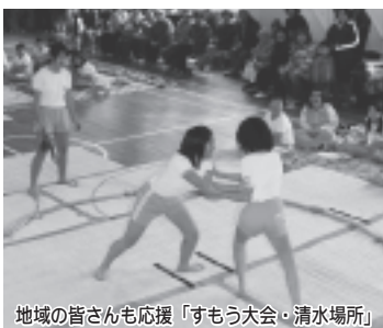
地域の皆さんも応援「すもう大会・清水場所」