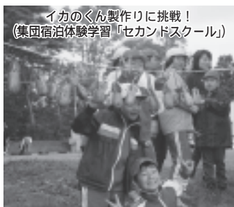
イカのくんと製りに挑戦！ (集団宿泊体験学習「セカンドスクール」)