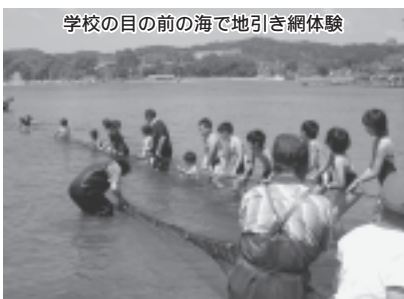
学校の目の前の海で地引き網体験