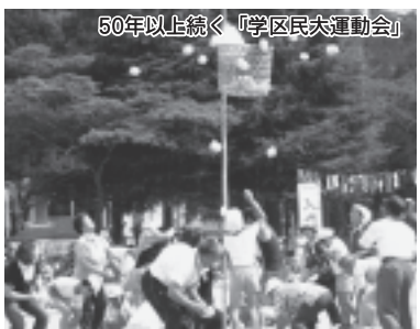
50年以上続く「学区民大運動会」

荒砥小学校沿革(概要) 明治6年 金秀寺(平磯)に「袖浜小学校」開校 明治13年 全慶寺(荒砥)に学校を移転 明治22年 志津川高等小学校荒砥分校設置 明治38年 現在地に新校舎落成、移転 昭和26年 新校舎落成 昭和27年 志津川町立荒砥小学校独立開校 昭和32年 校章制定 昭和37年 校舎、講堂増築落成 昭和44年 県教委指定「理科教育」研究公開 昭和47年 健康優良学校表彰(文部省・朝日新聞社) 健康優良学校優秀校表彰(県教委) 昭和53年 校木制定(桜) 昭和58年 交通少年団に県知事褒状 昭和63年 全日本健康優良学校表彰(朝日新聞社) 平成元年 優良PTAとして県PTA連合会表彰 平成2年 交通少年団に県警察本部長表彰 平成3年 プール落成 平成4年 優良PTAとして東北PTA連合会表彰 開校40周年記念式 平成5年 県指定「環境教育推進モデル式」 平成6年 県教委指定「学習指導(生活科・社会科)」研究公開 平成7年 県警察本部より交通安全優良学校表彰・感謝状 平成8年 全国海岸協会表彰 平成9年 日本PTA全国協議会表彰 平成11年 県教委指定「心をはぐくむ教育活動」実践発表会 平成13年 開校50周年記念式 平成14年 宮城県小学校文芸展「学校文集うなばら」優良賞 平成17年 市町村合併により南三陸町立荒砥小学校となる 平成19年 荒砥小学校祖父母会に全国漁業協同組合連合会より表彰 県警察本部より交通安全優良学校表彰・感謝状 平成20年 南三陸町立荒砥小学校閉校(3月31日) 南三陸町立志津川小学校へ統合(4月1日)