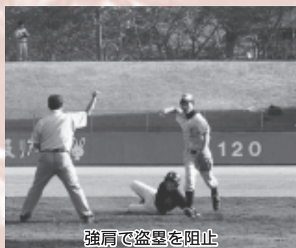
強肩で盗塁を阻止