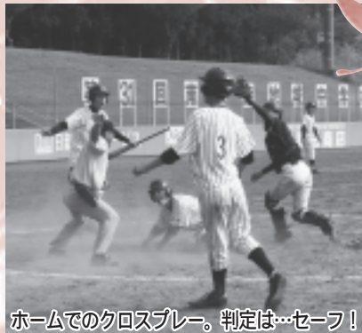
ホームでのクロスプレー。判定は…セーフ!