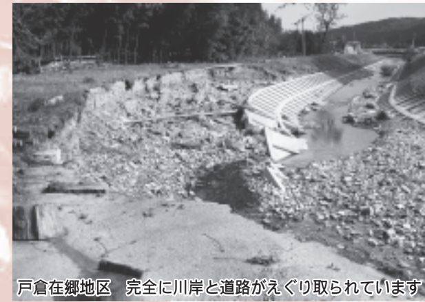
戸倉在郷地区 完全に川岸と道路がえぐり取られています