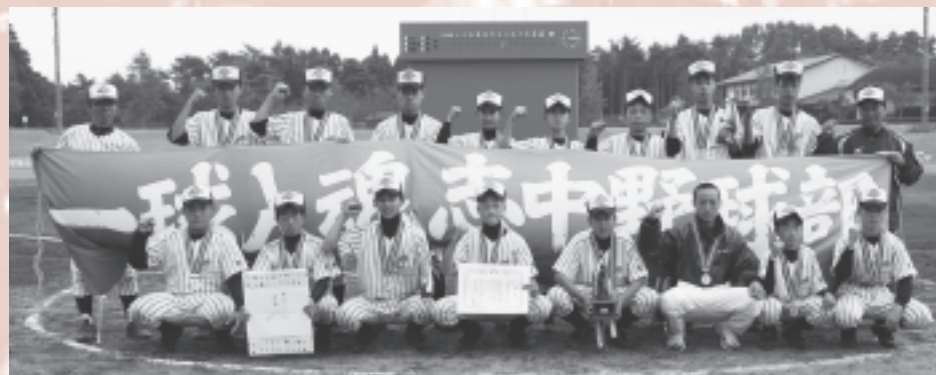
準優勝した志津川中学校野球部の皆さん