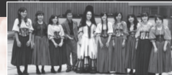
出演した生徒の皆さんとの記念撮影

迫力のあるオペラの合唱と演技に触れた生徒の皆さんは、「ブラボー!」と大きな声援と拍手を送っていました。また、第二幕の酒場のシーンには、志津川中学校の生徒9人が役者として出演し、プロと見分けがつかないほどの演技を見せてくれました。