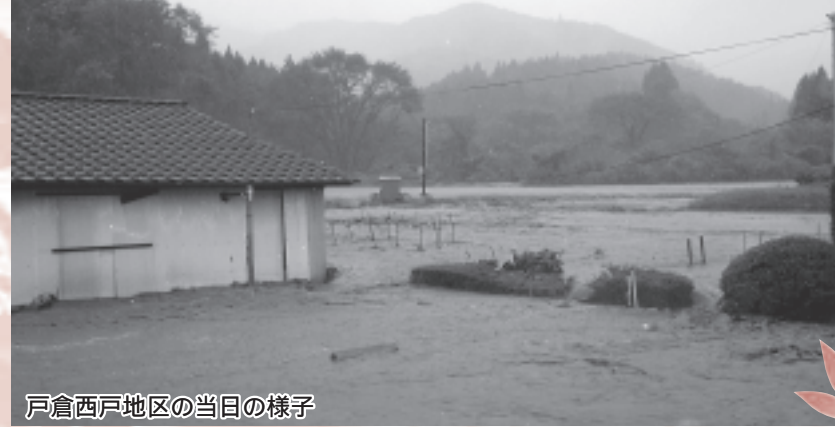
戸倉西戸地区の当日の様子