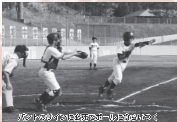
バントのサインに必死でボールに食らいつく