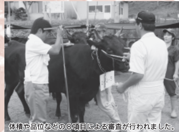
体積や品位などの8項目による審査が行われました。