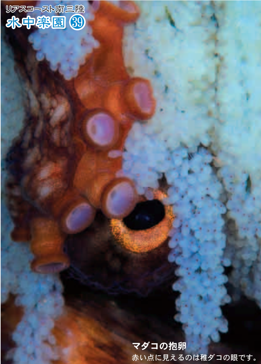
マダコの抱卵 赤い点に見えるのは稚ダコの眼です。