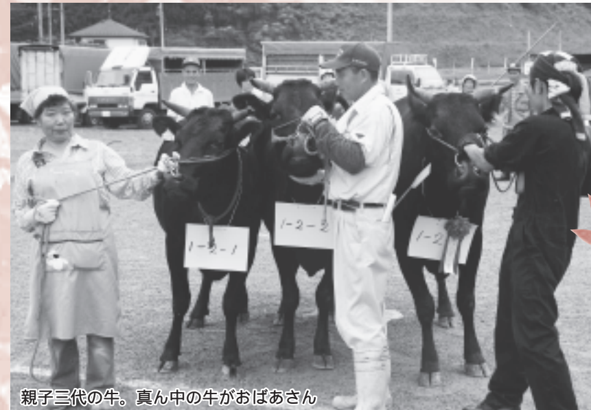
親子三代の牛。真ん中の牛がおばあさん