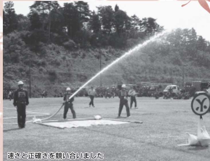
速さと正確さを競い合いました

9月6日(日)、南三陸町消防団秋季消防演習がスポーツ交流村多目的広場を会場に開催されました。今回は、第2回分団対抗小型ポンプ操法競技が12チームの参加で行われ、小型ポンプにホースを接続、延長し放水するまでの一連の動作を行い正確さと速さを競いながら、統率の取れた操法を披露しました。競技成績は次のとおりです。