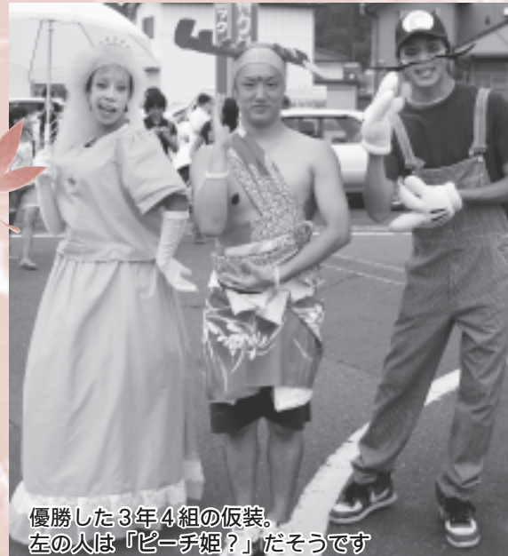
優勝した3年4組の仮装。 左の人は「ピーチ姫？」だそうです

集計の結果、「マリオwithせんとくん」をテーマに仮装した3年4組が優勝しました。