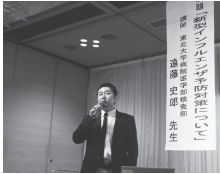
9月2日(水)に高野会館で開催された「新型インフルエンザ予防講演会」