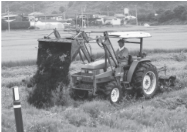
県内における農作業死亡事故の発生原因