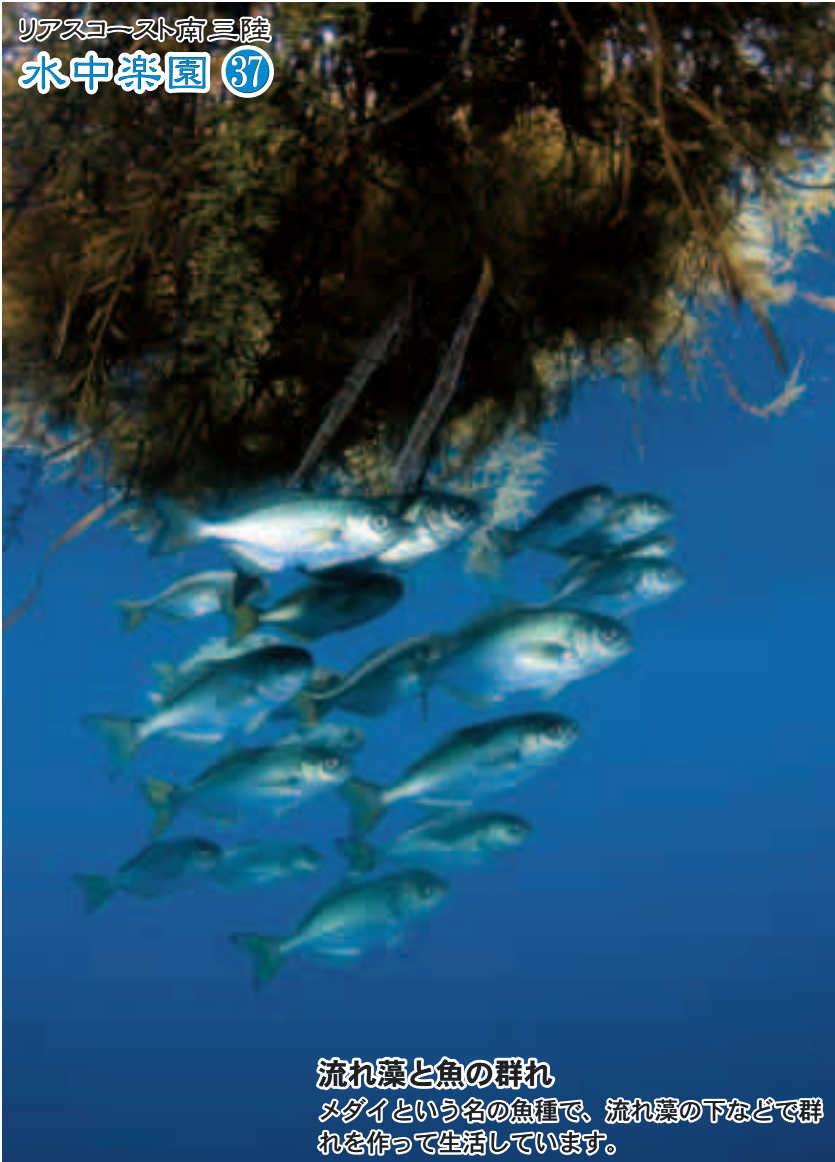
流れ藻と魚の群れ メダイという名の魚種で、流れ藻の下などで群れを作って生活しています。