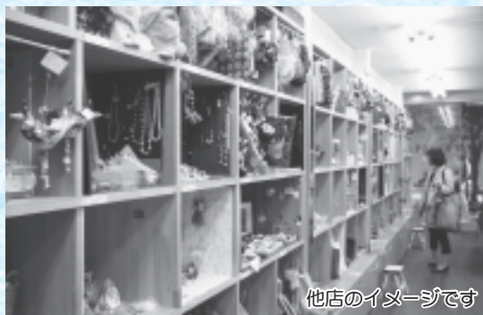
他店のイメージです

BOXショップには、個人・企業を問わずどなたでも申し込みできます。たとえは： ○自分のお店を持ちたいと思っている人 ○自分の作品を発表・販売したい人 ○会社やお店の宣伝として活用したい人 など、バラエティーに富んだスペースにしたいと考えています。