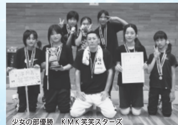
少女の部優勝 KMK笑笑スターズ

【少女の部】 優勝 KMK笑笑スターズ、準優勝 清水オレンジスマイル、第3位 85ポップガールズ、第3位 汐南本浜スマイリーズ