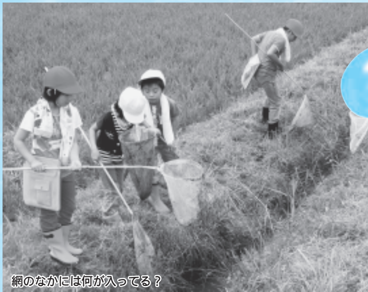
網のなかには何が入ってる？

手には虫取り網、足には長靴と準備万端な子どもたち。観察会が始まると、それぞれにちらばり、「どじょう発見！」「大きいかえるゲット！」など、次々に生き物たちを見つけて歓声を上げていました。