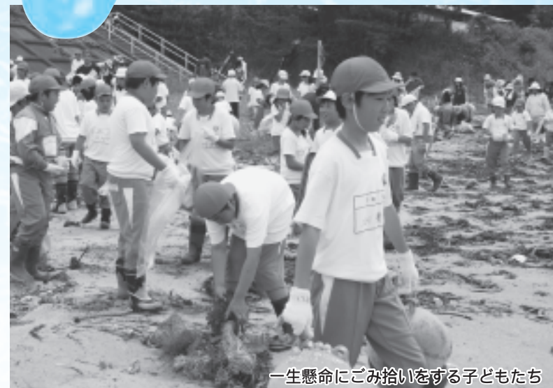
一生懸命にごみ拾いをする子どもたち

6月25日(木)、名足小学校の恒例行事である「ふるさとの海に親しむ会」が長須賀海水浴場で開催され、名足小学校の全校児童と泊浜地域の皆さんによる海岸清掃活動が行われました。