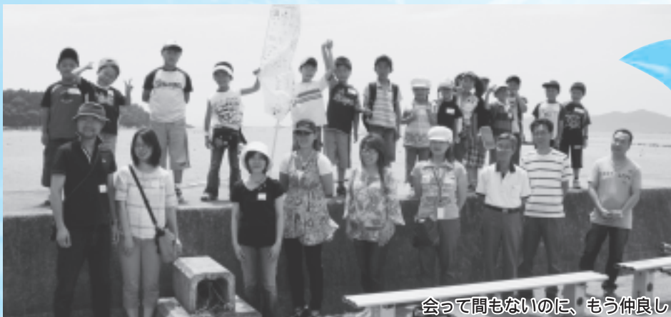
会って間もないのに、もう仲良し