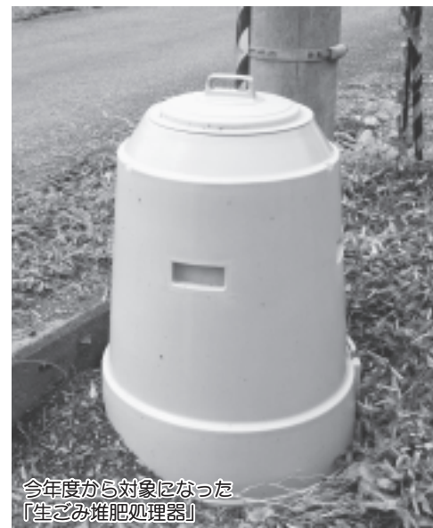
今年度から対象になった「生ごみ堆肥処理器」

住する場所で処理機等を適正に使用及び管理できる方。 ・家庭用の電動式生ごみ処理機及び生ごみ堆肥処理器 ※1世帯につき1台のみ補助対象とします。 ※町内の事業所、商店などから購入したものに限りません。 補助金額 ・電動式生ごみ処理機 購入費の2分の1(千円未満切り捨て)で、限度額は40,000円。 ・生ごみ堆肥処理器 購入費の2分の1(千円未満切り捨て)で、限度額は5,000円。