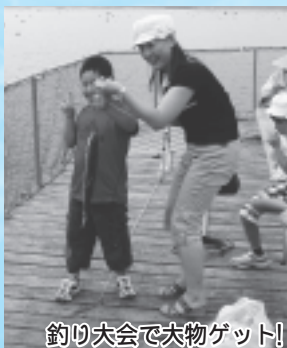
釣り大会で大物ゲット！

実際に漁船に乗りこんでの養殖作業体験または海鮮バーベキューやフィッシングパークでの魚釣りなど、ふんだんに盛り込まれた「南三陸町の海」を満喫し、参加した皆さんはととも満足した様子。特に、子どもたちはどこに行っても元気いっぱい、仲良くなったお友達と、汗を流して楽しんでいました。