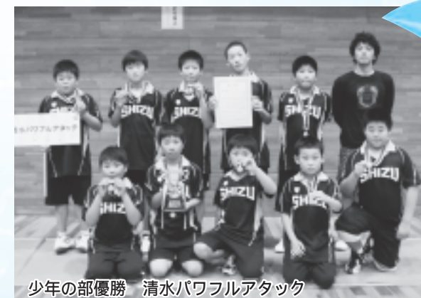
少年の部優勝 清水パワフルアタック