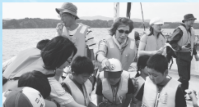
船の上でとりたてのホタテを食べる