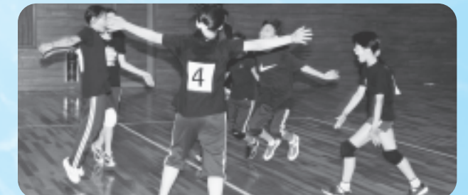
チームワークは万全！