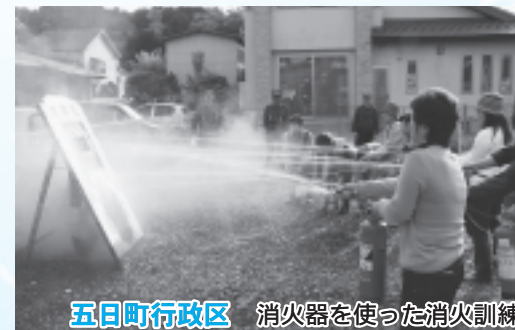
五日町行政区 消火器を使った消火訓練