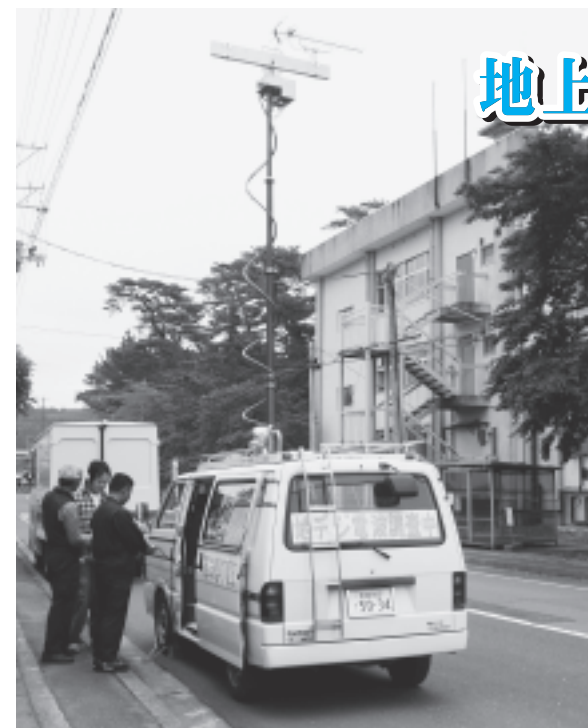
車両に付いた長いアンテナが目印です