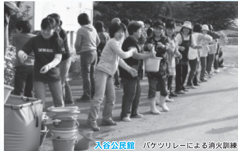
入谷公民館 バケツリレーによる消火訓練

当日は、早朝にもかかわらず関係機関や町民の皆さん約6,500人が訓練に参加しました。