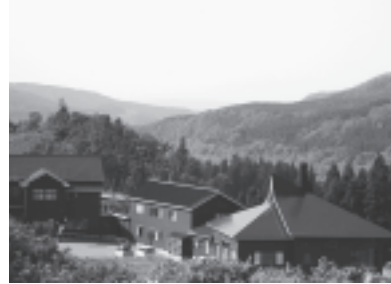
昨年リニューアルした月の沢温泉