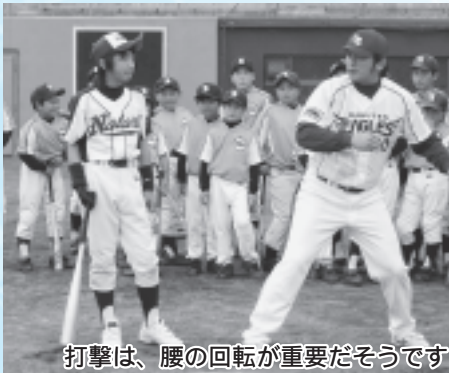
打撃は、腰の回転が重要だそうです

午後からは、楽天野球団の両ジュニアコーチによる野球教室が行われ、守備や打撃などの基礎を教わりました。元プロ野球選手からの指導に、子どもたちは目を輝かせていました。