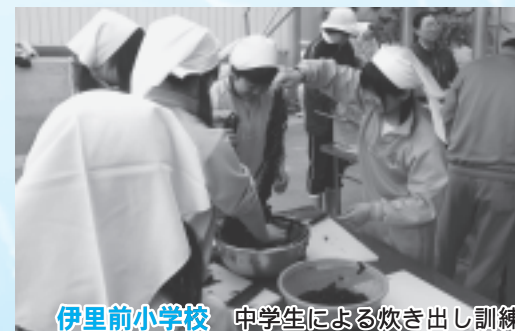
伊里前小学校 中学生による炊き出し訓練