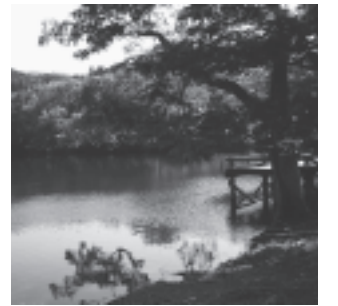
映画ICHIのロケ地となった鶴巻池