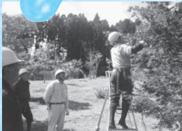
植木の剪定講習の様子

6月11日（木）、東京都の中野サンプラザで開催された全国シルバー人材センター事業協会総会の席上で、南三陸町シルバー人材センターが安全就業の優良センターとして表彰されました。