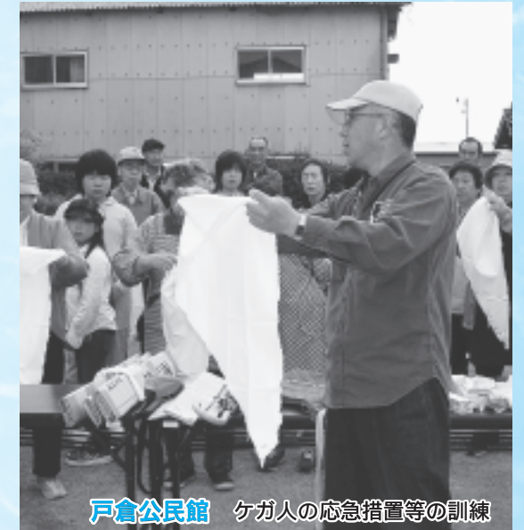
戸倉公民館 ケガ人の応急措置等の訓練