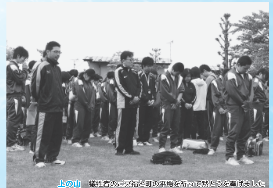
上の山 犠牲者のご冥福と町の平穏を祈って黙とうを奉げました