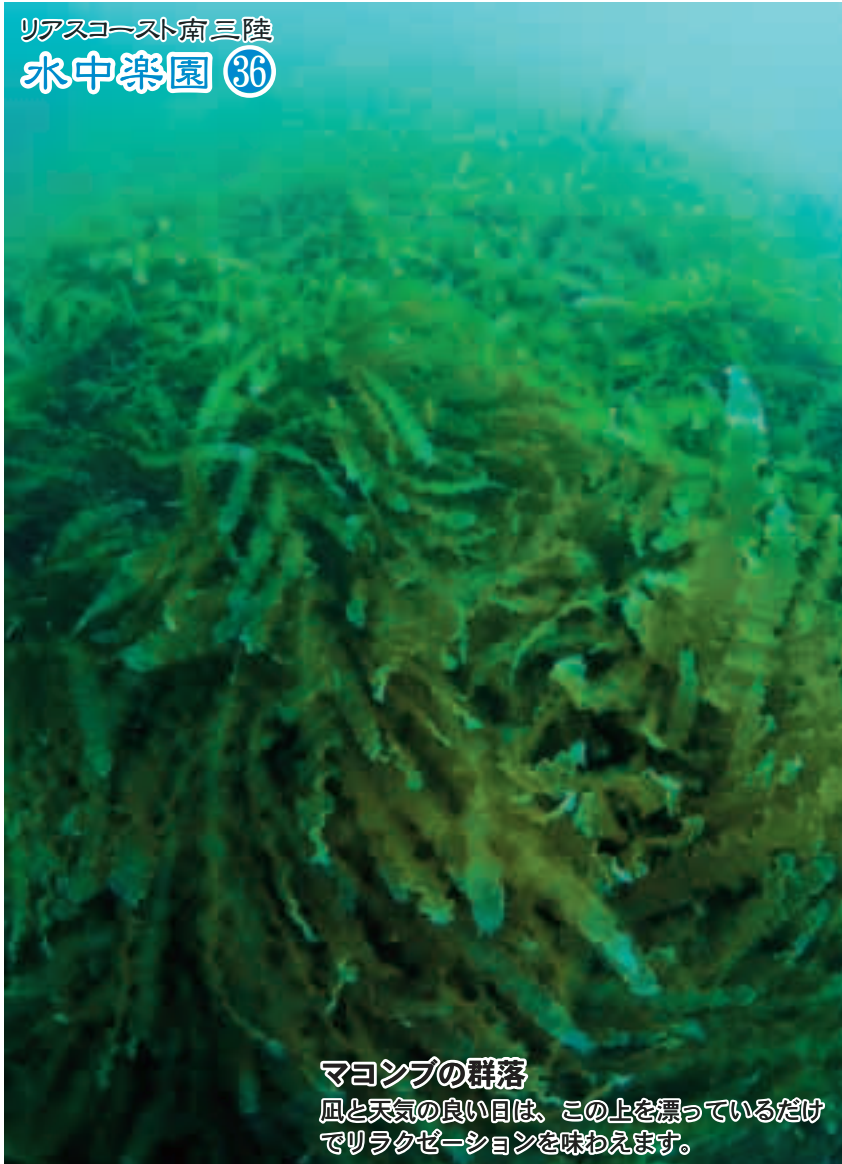
マコンブの群落 風と天気の良い日は、この上を漂っているだけでリラクゼーションを味わえます。