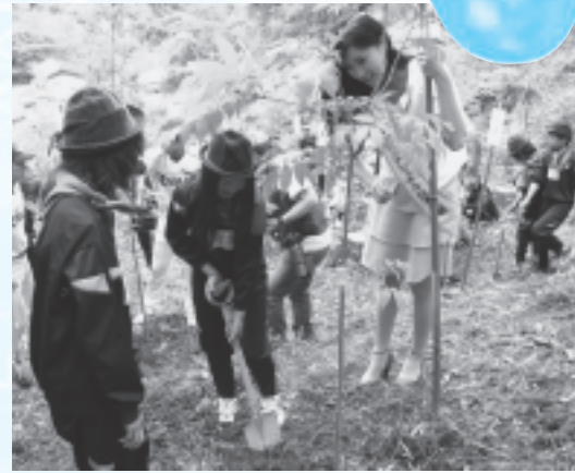
参加者全員で植樹を行いました