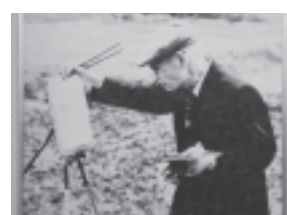
内藤秀因画伯の在りし姿