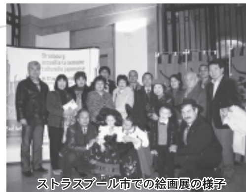
ストラスブール市での絵画展の様子

12月8日から20日にかけて行われたパリ市での絵画展にも、絵画35点が展示されました。