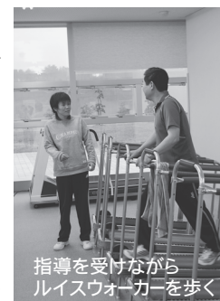
指導を受けながらルイスウォーカーを歩く

1回30分以上のルイスウォーカーでのウォーキングを、月10回以上、2カ月間(1月～2月)継続達成した方にステ