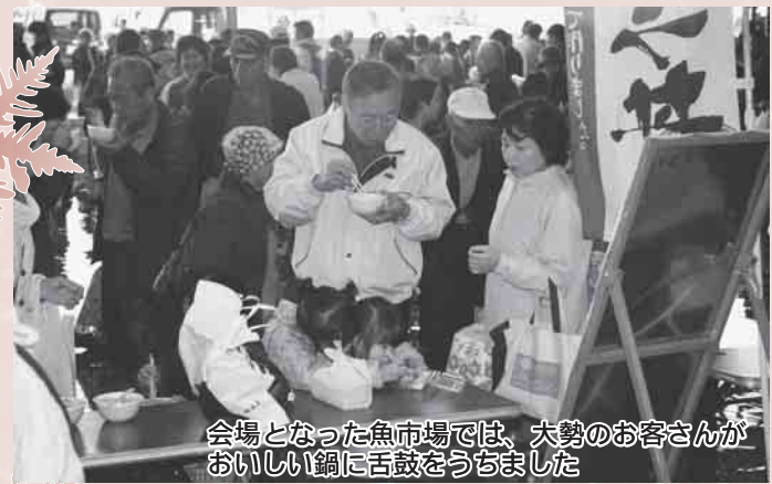
会場となった魚市場では、大勢のお客さんがおいしい鯛に舌鼓をうちました