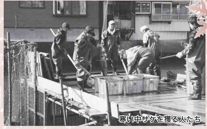
寒い中サケを獲る人たち

志津川の水尻川と八幡川でサケ獲りの作業が始まりました。サケの遡上は、11月20日ころからピークを迎え、多いときには1日に2千尾ほど獲れますが、今年は夏の猛暑の影響で例年より少ないようです。サケは4年で帰ってくると言われていますが、2年や7年で帰ってくるサケもいると、サケ獲りの作業をしている人が話してくれました。サケの年齢は、うろこを見ると分かるそうで、サケ獲りでは卵を取るだけでなく、今年帰ってきたサケの年齢を調べ、来年以降にどれぐらいのサケが帰ってくるかを予想する資料も作っています。(写真・文：戸倉中学校2年 佐藤裕さん) ※22ページ参照