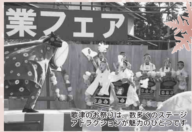
歌津のお祭りは、数多くのステージアトラクションが魅力のひとつです

10月31日(日)、「産業フェア志津川会場」と「志津川湾さけまつり」が志津川魚市場で合同開催されました。台風14号の影響で、サケのつかみどりなどの一部のイベントが縮小されましたが、恒例となった南三陸大鍋国技館や無料で振舞われたサケ汁などに、大勢のお客さんがおいしい笑顔を見せていました。