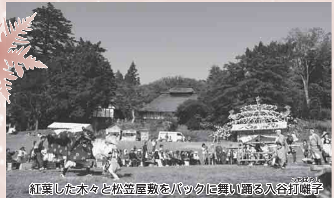
紅葉した木々と松笠屋敷をバックに舞い踊る入谷打囃子

11月7日(日)、入谷ひころの里で「ひころの里秋まつり」が開催されました。朝採りの新鮮野菜やはっと汁などが販売されたほか、郷土芸能の入谷打囃子やチェーンソーを使って丸太から彫刻の作品を造るチェーンソーアートなどが披露され、大勢のお客さんが入谷ならではの山里の秋祭りを楽しみました。