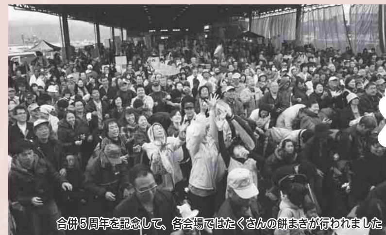
合併5周年を記念して、各会場ではたくさんの餅まきが行われました

旬の食材が豊富なこの秋、町内各地で南三陸町ならではの秋のお祭りが開催されました。