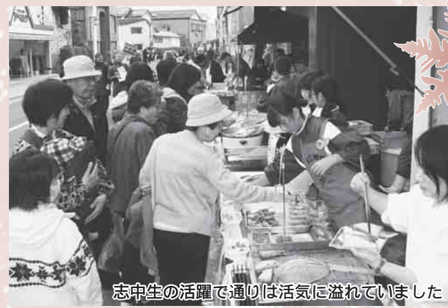
志中生の活躍で通りは活気に溢れていました

11月14日(日)、志津川南町の通称おさかな通りで「志津川おさかな通り大漁市」が開催されました。開始早々、お魚通りには歩行者天国と見間違うほどのお客さんが集まり、体験学習で参加した志津川中学校1年生の皆さんが、元気な声でクーポン券の販売などを行っていました。各店舗自慢の商品や新鮮な山海の幸が店頭と並んだほか、無料の試食品を提供する店もあり、活気あふれる1日となりました。