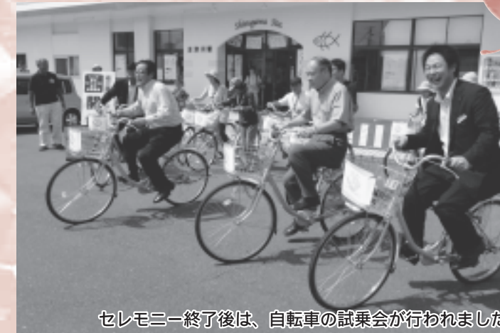
セレモニー終了後は、自転車の試乗会が行われました