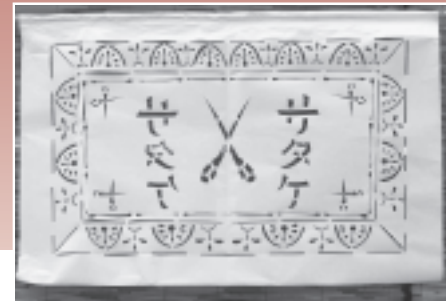
お店のイメージや家々の宝物などを取材してキリコを一枚一枚丁寧に切り抜きました。

8月28日(土)から9月5日(日)の9日間、仙台を中心にアートによる地域活性活動を行っている任意団体「ENVIS | S | (エンビジ)」の主催で、「生きる博覧会2010～夏編～」が開催されました。期間中、JR志津川駅からおさかな通りに至る約1キロの通りに、地元の女性有志らが制作した約650枚の「キリコ」が涼やかに装飾され、商店や家々のエピソードを発見しながら散策する「へえへえウォーキングツアー」、そして南三陸町の新なる魅力となる「パワースポットツアー」などが開催されました。夏の終わりを告げる海辺の町へ、遠くは関東方面からもお客さんが訪れ、南三陸町の「アートリズム」を満喫していききました。