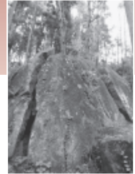
パワースポットツアーでは、大雄寺・神行堂山の巨石・太郎坊の杉・荒島を巡りました。見慣れた場所でも、見る視点を変えることで新たな発見が生まれました。