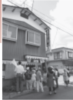
お店の方や沿道の方々の何気ない一言が、町を訪れるお客さんにとって温かい思い出になったようです。