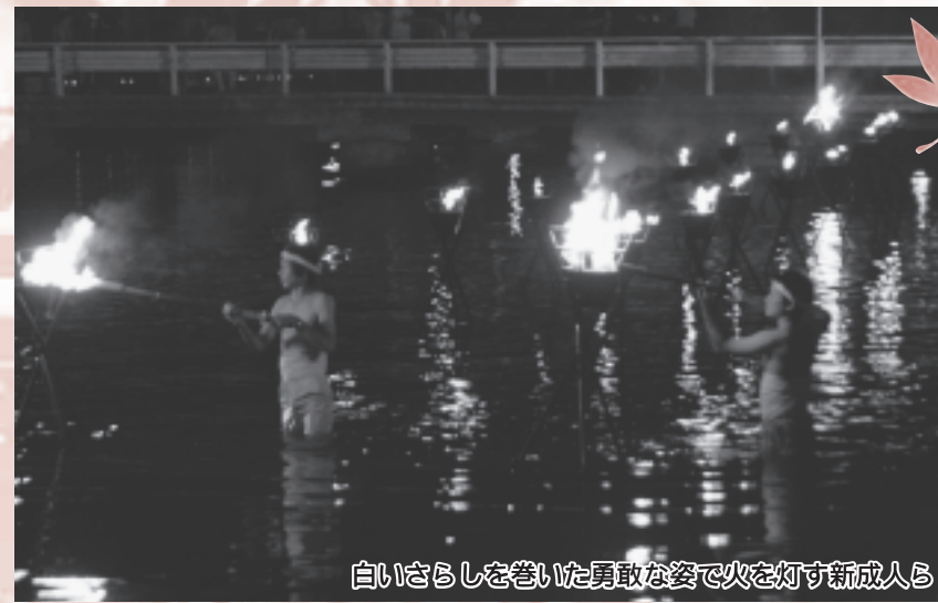
白いさらしを巻いた勇敢な姿で火を灯す新成人ら

上山八幡神社から運んできた御神火を、今年の新成人3人と有志1人が持つたいまつに移すと、川の中に設置された64基のかがり火にゆっくりと点灯していき、すべてのかがり火が灯されると、会場からは大きな拍手が沸き起こりました。幻想的な雰囲気が漂う会場では、迎え太鼓やヨサコイなどのアトラクションが行われたほか夜店もオープンし、家族連れなどの大勢のお客さんが、かがり火と夜のお祭りを楽しみました。