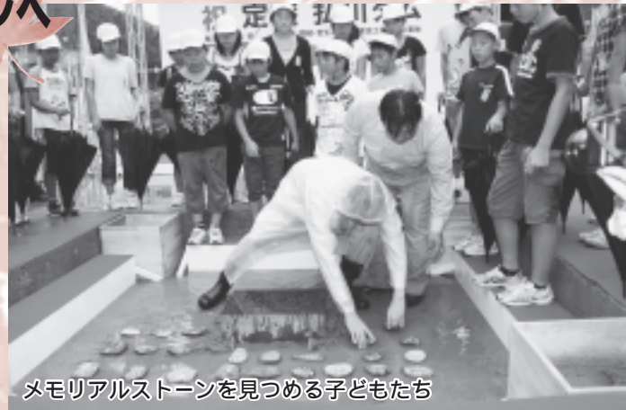
メモリアルストーンを見つめる子どもたち

町や県、工事関係者など、約100人が見守るなか、ダムの中央に「定礎」と彫られた幅50センチほどの礎石が据えられると、そのまわりには、伊里前小学校6年生23人が将来の夢や目標を書き込んだメモリアルストーンが敷き詰められました。その後、クレーンで運ばれてきたコンクリートが、号令とともに一斉に流されると、会場からは大きな拍手が沸き起こりました。弘川ダムは、平成25年3月の完成を目指し今後も工事が進められます。