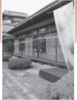
通りの一角には、地域のお母さんたちがボランティアでお客様をもてなす「漬物カフェ」や庭園を空間演出した「カフェ志津川」が登場しました。どちらも素敵な空間でした。