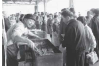
新鮮な魚介類の炭火焼きもあります