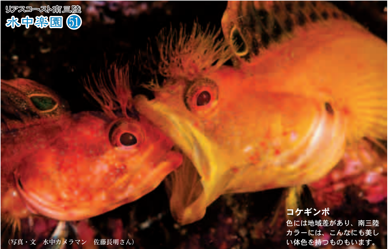
(写真・文 水中カメラマン 佐藤長明さん)