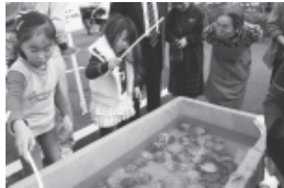
子どもたちに人気のホタテ釣り