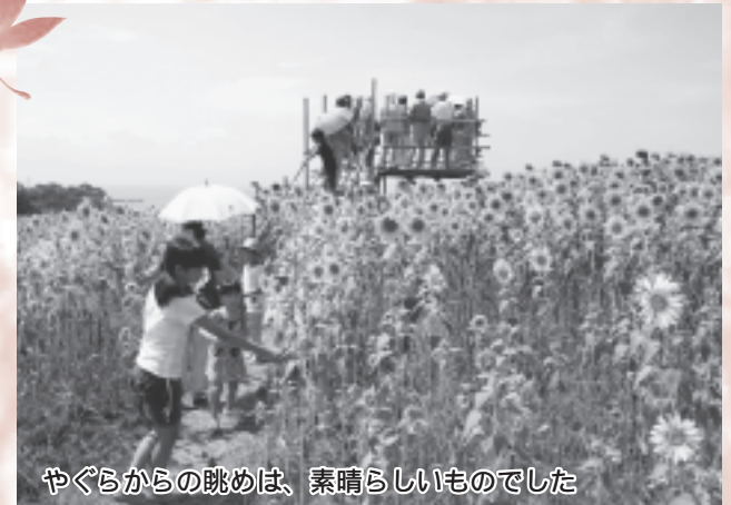
やぐらからの眺めは、素晴らしいものでした

現地には、山並みと青い海を背景に咲き誇るヒマワリ畑を見渡せるようにと「やぐら」も設置され、初日から大勢のお客さんが満開のひまわりを楽しみました。