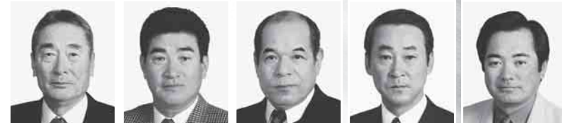
金田 正一さん 山本 浩二さん 衣笠 祥雄さん 若松 勉さん 北別府 学さん