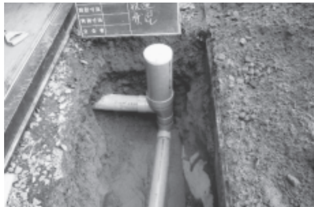
下水道への接続状況 (平成22年5月31日現在)

下水道は、家庭から排出された水を集めてきれいにするにより、生活環境を良くし川や海の水質を保全するという重要な役割を担っています。まだ接続されていない方は、早期な接続をお願いします。