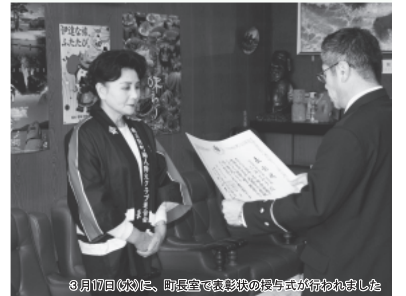
3月17日(水)に、町長室で表彰状の授与式が行われました