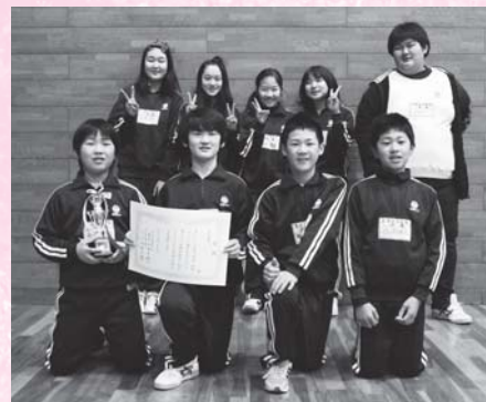
準優勝 ジャイアントチーム