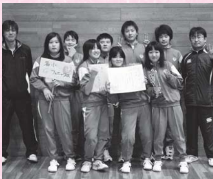
優勝 名小G(ギャラクシー)フェニックス