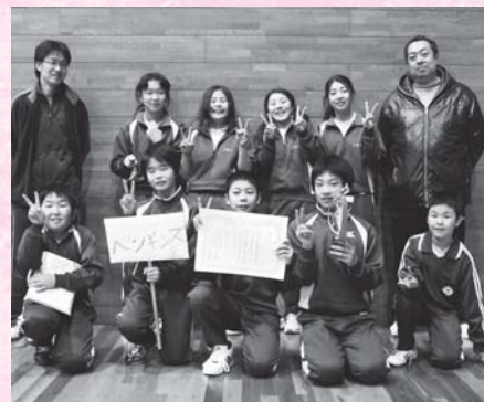
第3位 戸倉ペンギンズ