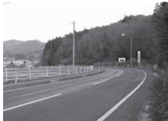
路面が凍結しやすい日陰は、特に慎重に運転するよう心がけましょう。

冬道では、道路に雪や氷がなくても日陰や橋が凍っていることがあります。晴れている日でも注意が必要です。