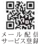
メール配信サービス登録

パソコン用 http://minamisanriku.todoku.jp/p/member_register.php 携帯電話用 ml@minamisanriku.todoku.jp 空メールを送信してください。