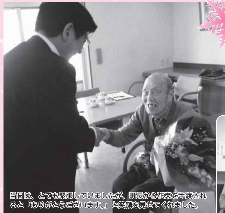
今回は、とても緊張していましたが、町長から花束を手渡されると「ありがとうございます。」と笑顔を見せてくれました。

「ここでの生活はとても幸せです。南三陸町にも、こんなところがあるといいのに。」とケアハウスでの生活を気に入っているようでした。