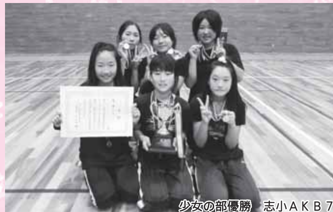
少女の部優勝 志小AKB7