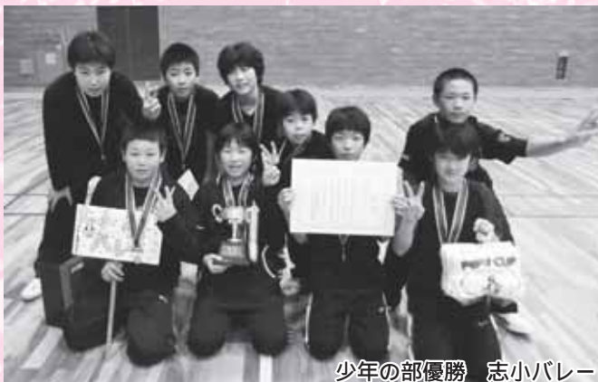
少年の部優勝 志小バレー