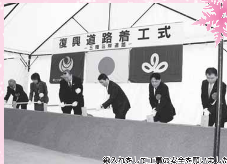
鍬入れをして工事の安全を願いました

町長は「今回の震災により国道45号線が寸断され、あらためて三陸道の重要性を認識しました。復興道路という位置づけであるので、このトンネルを期に復興ののろしを発信していきたい。」と話しました。なお、トンネルの開通は、平成28年度以降を見込んでいます。