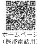
ホームページ(携帯電話用)

パソコン用 http://www.town.minamisanriku.miyagi.jp/ 携帯電話用 http://www.town.minamisanriku.miyagi.jp/m/