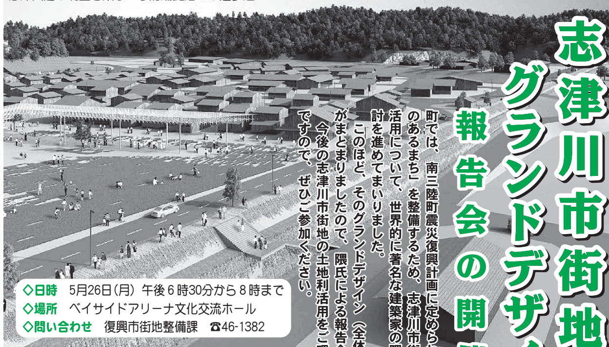
志津川湾の眺望を楽しめる防潮堤沿いの遊歩道