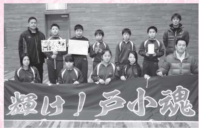
第3位 戸倉ブルースター