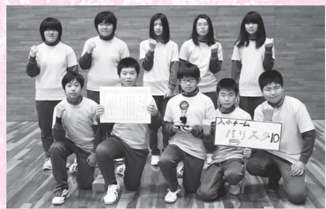
優勝 入小チームバリスタ・10