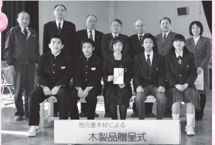
地元産木材による 木製品贈呈式