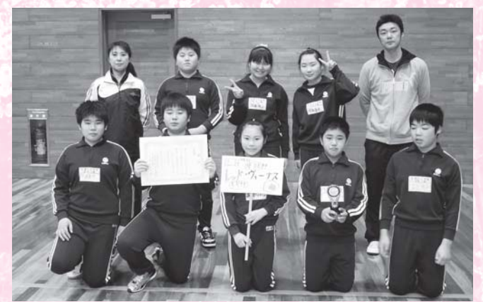
準優勝 志小レッド・ヴィーナス