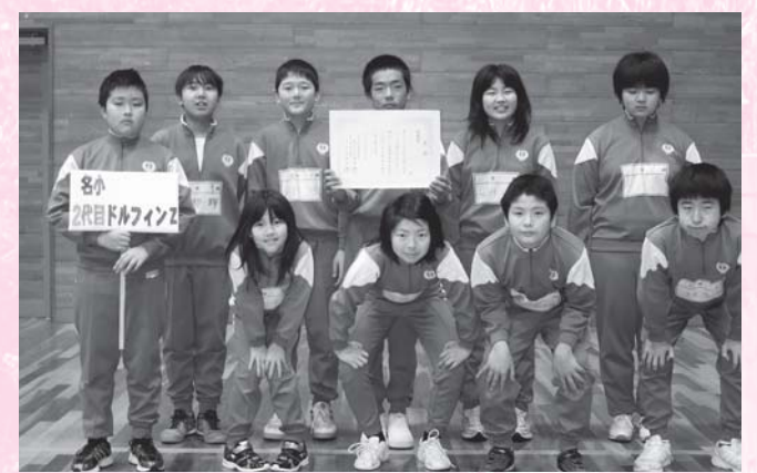
敢闘賞 名小2代目ドルフィンズ