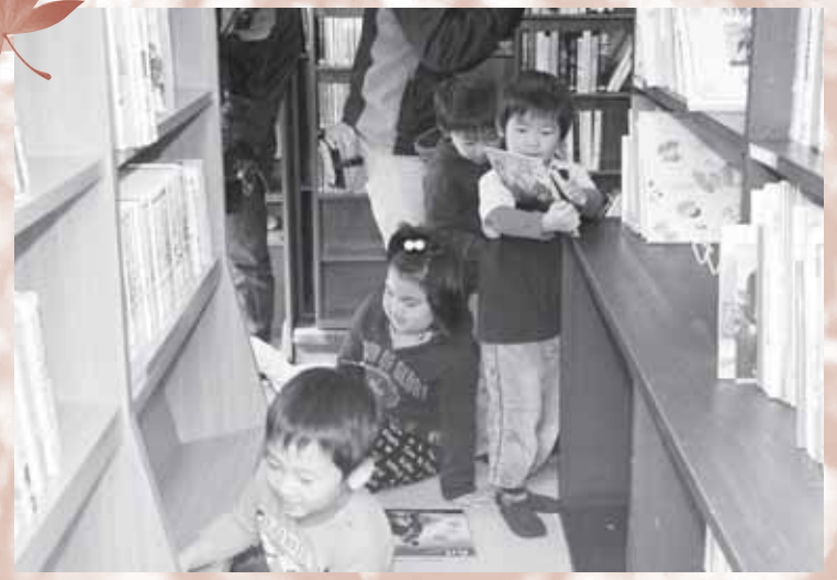
本が好きな子どもたちのために、移動図書館の運行も予定しています

図書館の利用時間は、午前10時から午後3時までとなっていますので、どうぞ気軽にご利用ください。