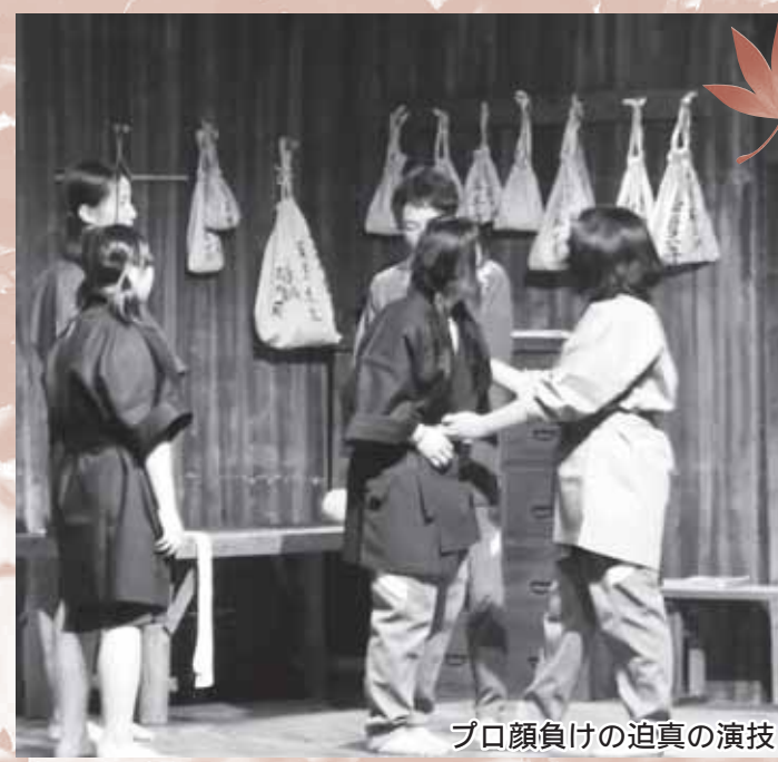
プロ顔負けの迫真の演技

本番当日、実演に参加した生徒の皆さんは、本格的な舞台セットに少し緊張しながらも、大きな声でセリフを話し、堂々とした演技を見せてくれました。