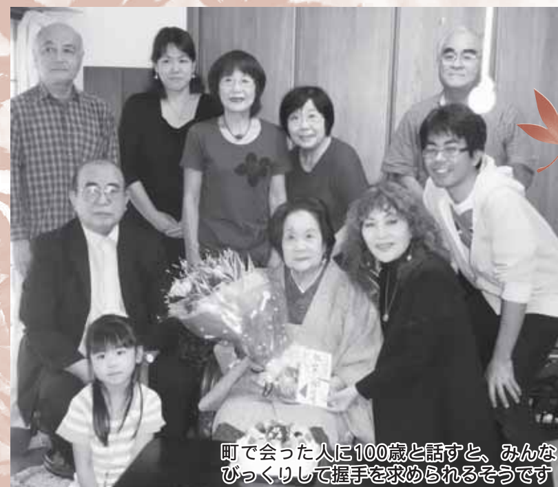
町で会った人に100歳と話すと、みんなびっくりして握手を求められるそうです