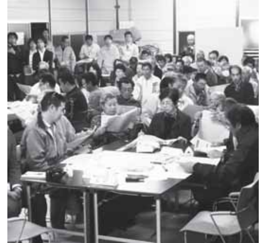
10月7日(金)に開催した説明会の様子

10月7日(金)からの3日間、被災市街地復興推進地域の指定に関する説明会を開催し、大勢の方にご参加いただきました。ご多忙の中、ありがとうございました。会場では活発な意見が交換されましたので、その一部をご紹介します。