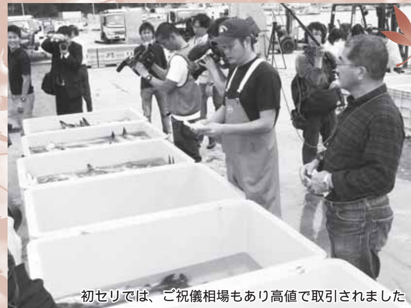
初セリでは、ご祝儀相場もあり高値で取引されました