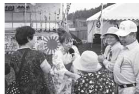
第4回復興市にもかけつけてくれました

が南三陸町の復興に協力してください。私ができる事、みんなできる事、人が、町が、一歩でも前に進むことができる様に、みんなで協力して助け合っています。そして、こんな私ですが、私の唄で一瞬でも気持ちが穏やかになっていただけるとあれば、私も一生懸命に唄い続けたいと思います。最後に、ご家族、ご親族の尊い命をなくされた方々に、お見舞いを申し上げますとともに、犠牲となられた大勢の方々のご冥福を心からお祈りいたします。