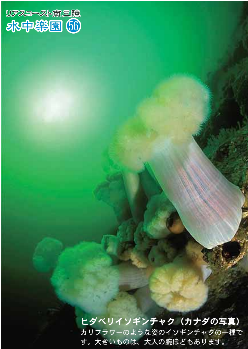
ヒダベリイソギンチャク (カナダの写真) カリフラワーのような姿のイソギンチャクの種類です。大きいものは、大人の腕ほどもあります。