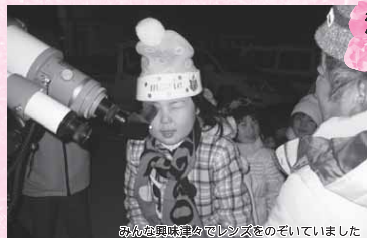
みんな興味津々でレンズをのぞいていました