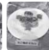
たこ焼きマフィン