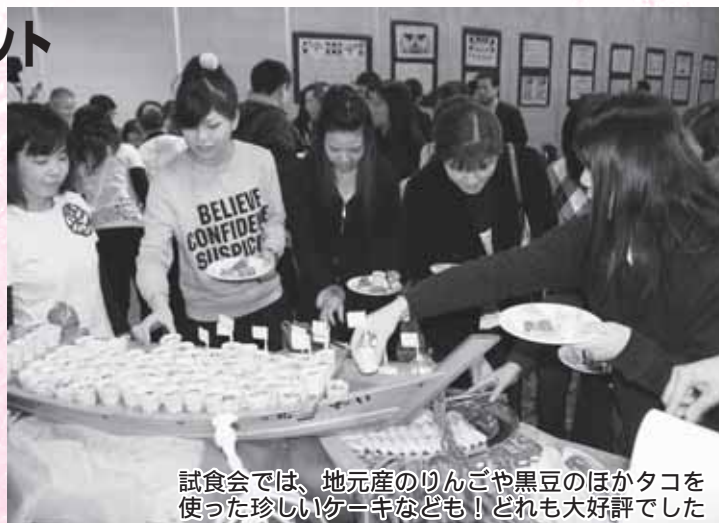
試食会では、地元産のりんごや黒豆のほかたこを使った珍しいケーキなども！どれも大好評でした