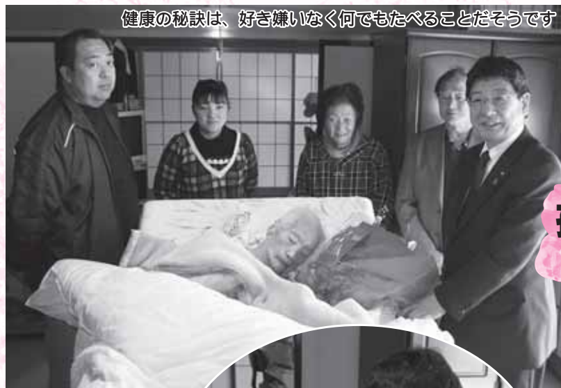
健康の秘訣は、好き嫌いなく何でもたべることだそうです

普段肉眼ではなかなか見られない星々の姿に、大人も子どもも夢中になり、「きれいだね。」「見えた！」などと感激した様子でした。