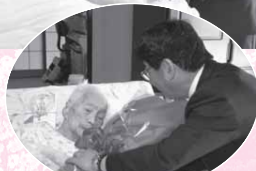
町長から花束を渡されると「ありがとうございます」とお礼の言葉を話しました