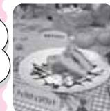
アップルチョコパウンド