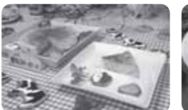
里山りんごのチーズケーキ

スイーツ試食会 女性たちが旅の目的にするようなスイーツってなんだろう？というテーマのもと、受講生によるスイーツ研究会が行われ、報告会ではその研究会で生まれた11種類のスイーツをご来場の皆さんに試食していただきました！