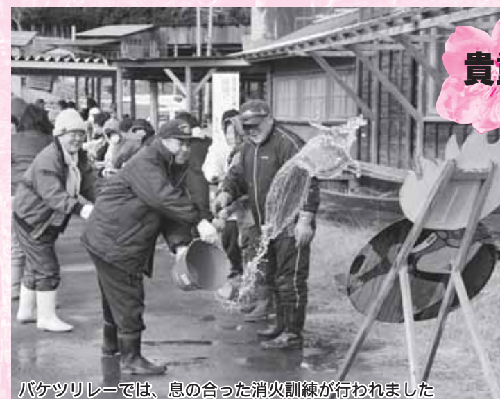
バケツリレーでは、息の合った消火訓練が行われました