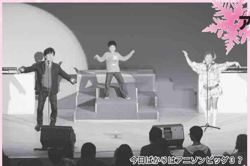
今日はやはりアニソンビッグ3?