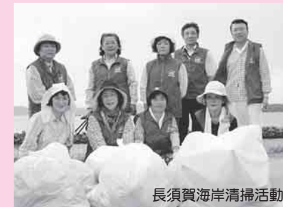
長須賀海岸清掃活動

毎年冬の恒例となりました、大手旅行会社が主催するバスツアーがスタートしています。このツアーでは、ひろこの里や湾内クルージング、キラキラいくら井など、地域の魅力を存分に満喫していただいています。また、なんとといってもこのツアーの魅力は、地域ガイドが添乗し地元の心温まる言葉と笑顔でおもてなしをすることです。