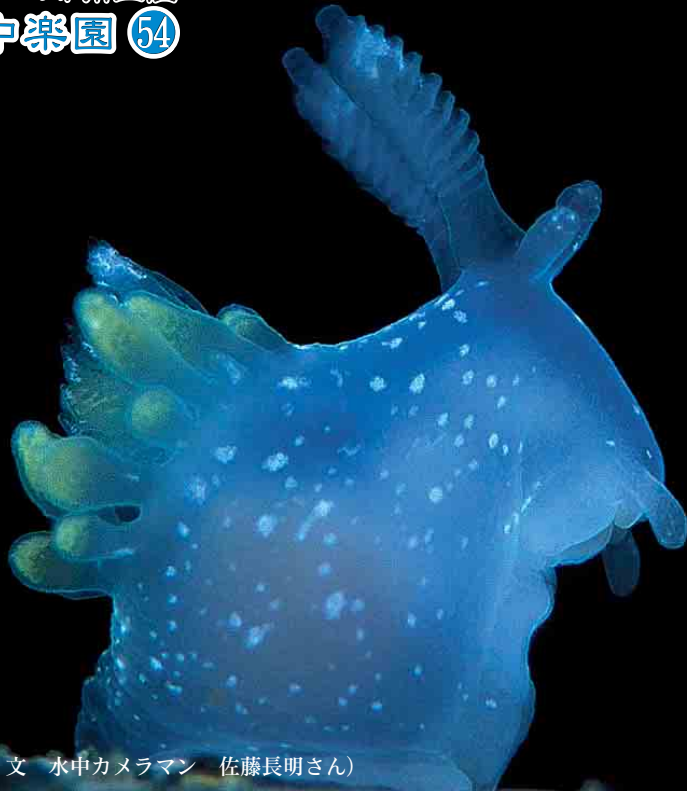
(写真・文 水中カメラマン 佐藤長明さん)