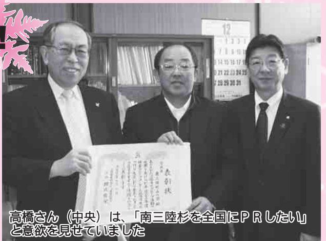
高橋さん(中央)は、「南三陸杉を全国にPRしたい」と意欲を見せていました

高橋さんは、「南三陸杉～「森林」づくり「人」づくり「地域」づくり～」と題して、これまで南三陸町山の会が実践してきた、南三陸産の木材をブランドとして売り出すための活動や良質の木材を育てる研究の成果などを発表しました。12月7日(火)には、町長に表敬訪問し、受賞の喜びを話しました。