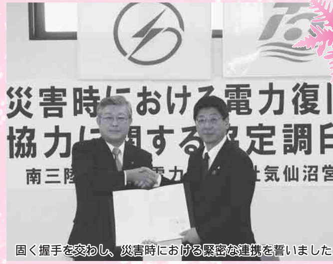
固く握手を交わし、災害時における緊密な連携を誓いました