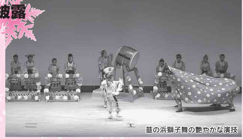
葦の浜獅子舞の艶やかな演技

行山流水戸辺鹿子舞、長清水鳥囃子、入谷打囃子、葦の浜獅子舞、戸倉小心輪海、八幡町打囃子、大森創作太鼓旭ヶ浦の7団体が出演し、普段は大人が演じている郷土芸能を、この日は、地域の伝承活動として日ごろから練習を積み重ねてきた子どもたちが演技を披露しました。艶やかで力強い演技に、会場からは大きな拍手が送られました。