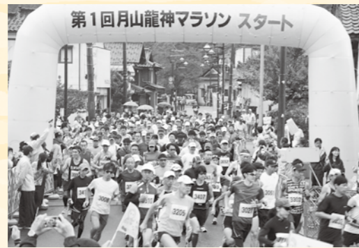
マラソンスタート

詳しくはこちら 月山龍神マラソン ☎ 月山龍神マラソン実行委員会事務局(庄内町観光協会) ☎0234-42-2922