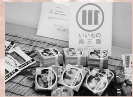
▲「南三おふくろの味研究会」による缶詰