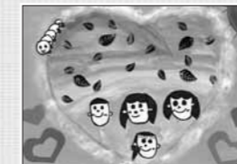
ハートにつつまれた南三陸町