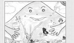
みんな仲良し〜ひとつのつながり〜