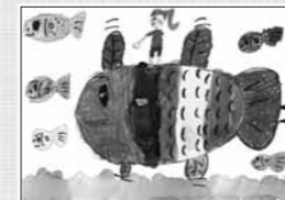
魚といっしょに空をとぼう!