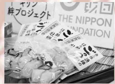
▲「戸倉漁師の会」によるカキの酒粕漬け