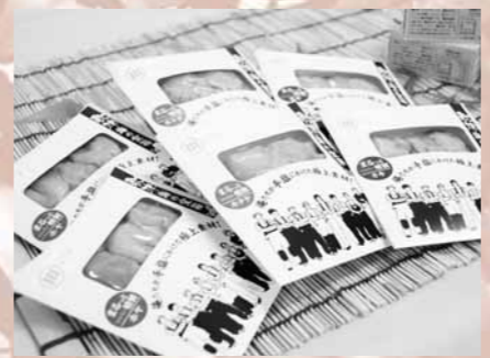
▲「歌津うんめえもの研究会」によるくん製

他の職場にいる生徒達も働く大変さや命の重みなどを知り、真剣な態度でジュニアインターンシップの3日間を終えました。