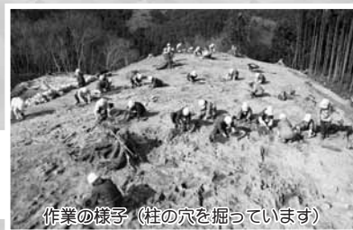
作業の様子(柱の穴を掘っています)

平成25年から26年にかけて新井田館跡で調査が行われ、出土した物と放射性炭素年代測定値から、館跡の主な時期は15世紀代と考えられます。